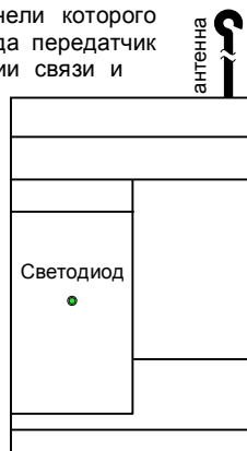
Рис. 1. Внешний вид передатчика

Для проверки радиоканала передатчика RS-202TC-RR необходимы заведомо исправные базовая станция (БС) RS-202BS и пульт централизованного наблюдения (ПЦН) RS-202PN.